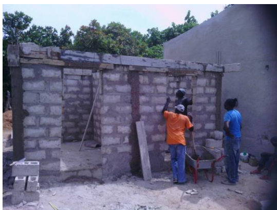
Toiletblok in aanbouw