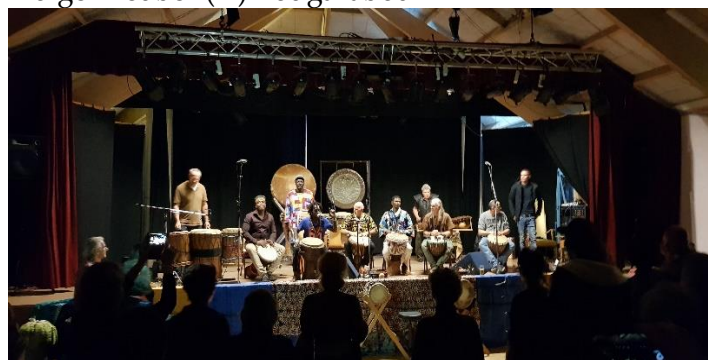
Jamsessie van alle artiesten