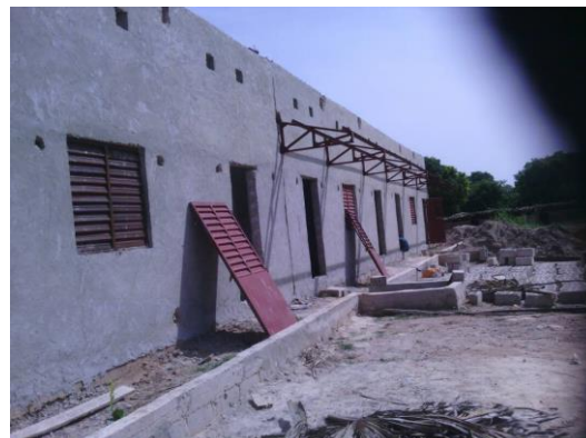
Metalen deuren en ramen