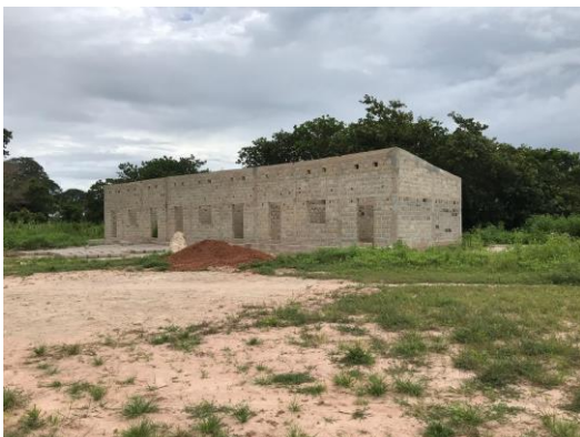
3 Klaslokalen gefinancierd door Senegalese overheid

Met deze klaslokalen, het lokaal dat eerder door Stichting Vrienden van Kelediang (Groningen) en de 2 klaslokalen die we in 2019 gaan bouwen beschikt de school straks in schooljaar 2019-2020 over 6 klaslokalen en een toiletblok. Het geheel wordt gecompleteerd met de 6 klaslokalen die we in twee jaar (2020 en 2021) willen realiseren. Dan beschikt de school over alle benodigde klaslokalen om de verwachte leerlingeninstroom op te kunnen vangen.