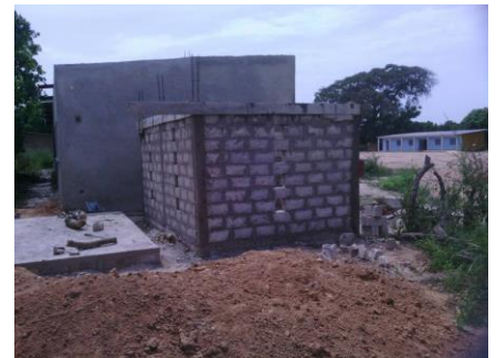
Nu nog een dak en afwerken