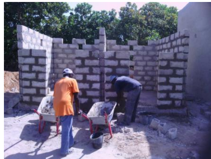
Septische put en 2 x 2 (J-M) toiletten